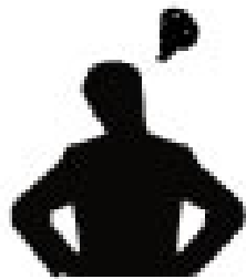
不利や困難に遭遇した退所者