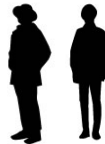
退所者が頼ることができる人